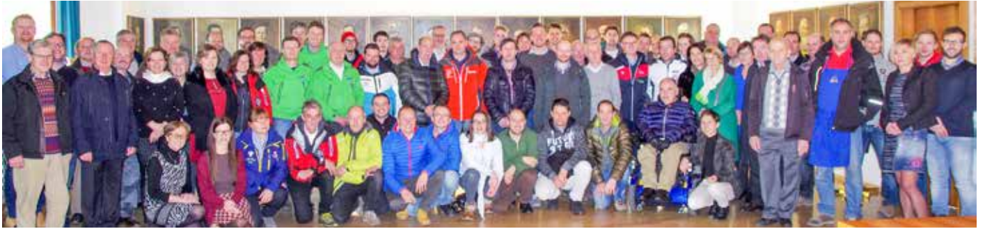
A Urtijëi iel belau 80 lies: I reprejantanc ie ala fin dl ann unic nviëi dal Chemun de Urtijëi a na ancunteda te Chemun

Truëp reprejantanc dla lies à tëüt pert al'ancunteda tradiziunela, metuda a jì dal Chemun de Urtijëi te Cësa de Chemun.